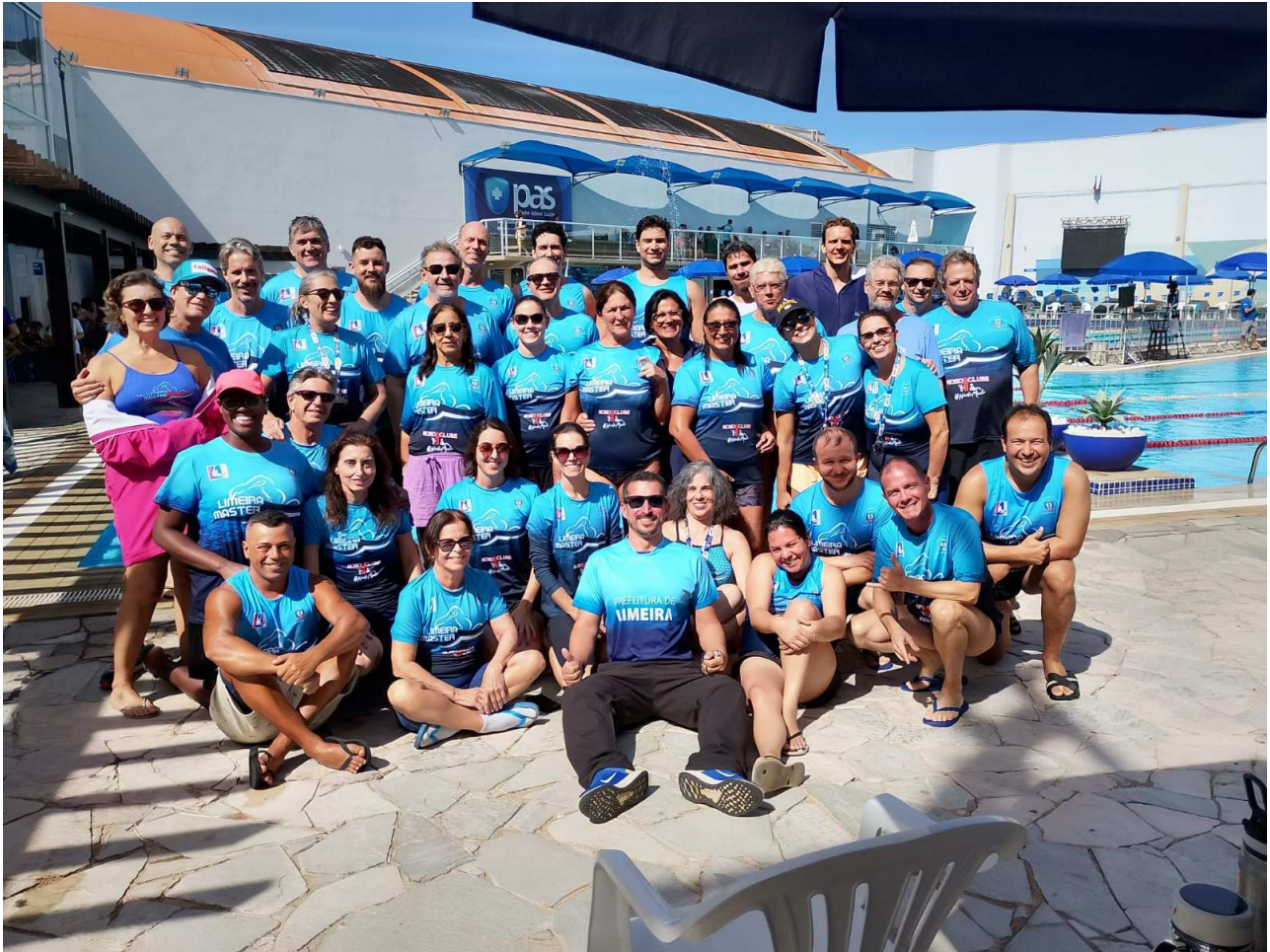
FOTO DA EQUIPE NO EVENTO